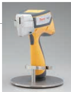
溶接部簡易測定マスク取付け後