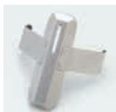
溶接部簡易測定マスク

スリットでX線を絞り(測定面積：3mm×約10mm)、溶接ビード、隅肉の測定に有効。